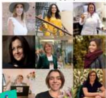
Les entrepreneures engagées de France Active Savoie Mont-Blanc

Quand les Femmes s'engagent pour les Femmes